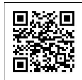
國立雲林科技大學 電子工程系網頁 QR code